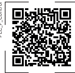
Dein QR-Code | hier scannen