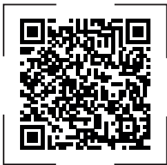
Your QR-Code | Scan here